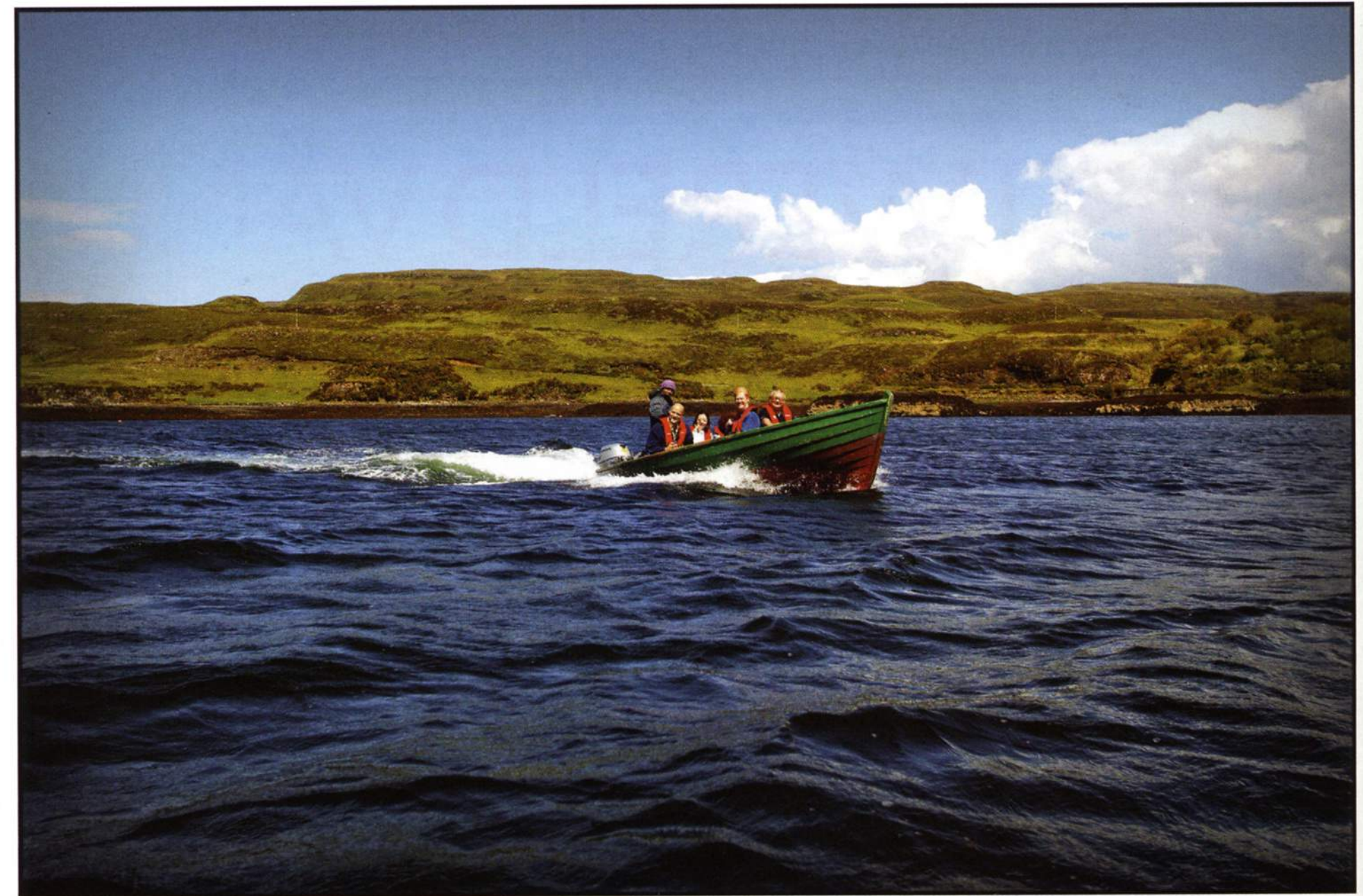
Het heldere water van de Schotse westkust trekt vissers, toeristen en zelfs wetenschappers aan.