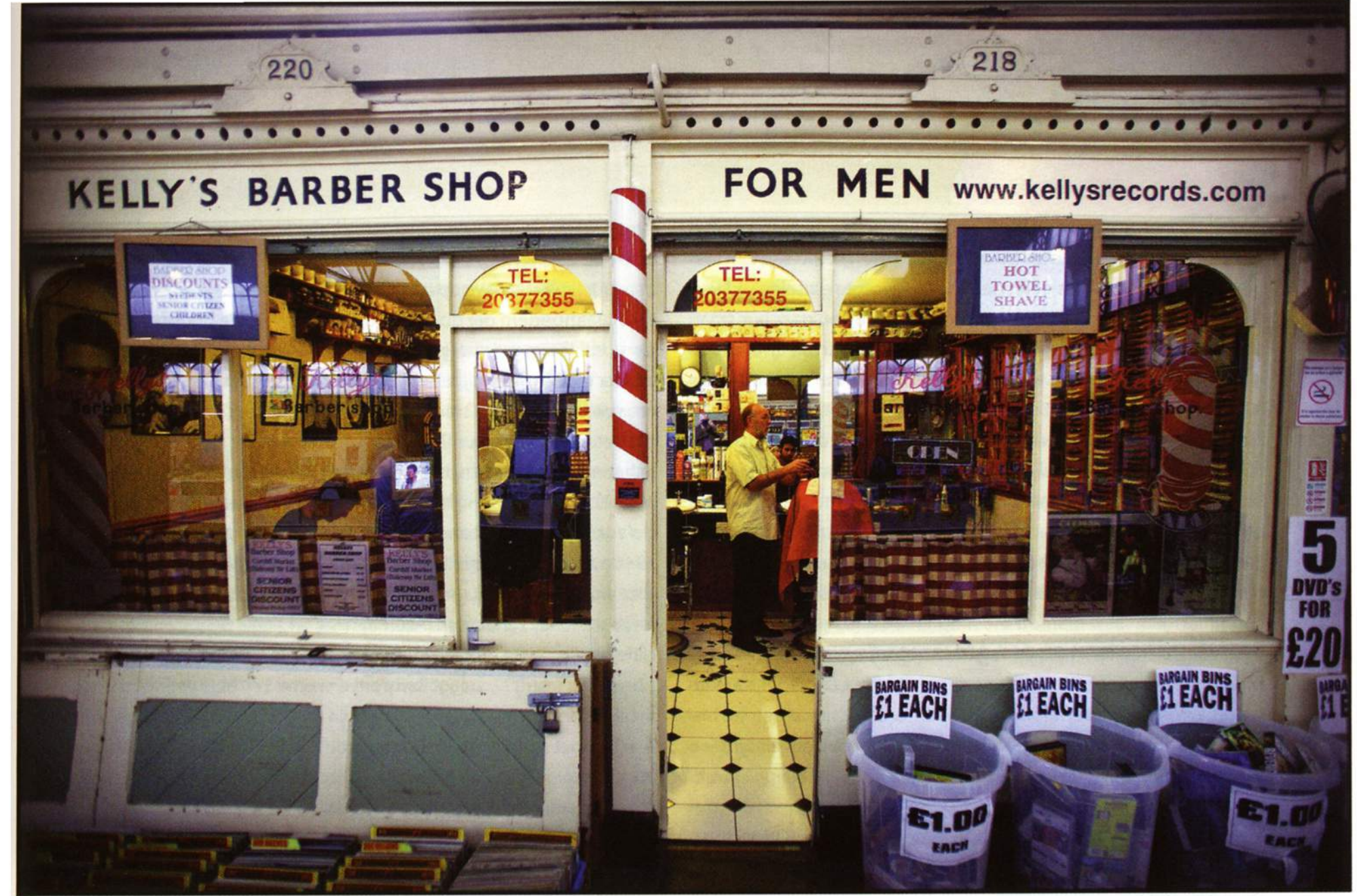
Boven: zelfs de steden ademen hier landelijkheid: op de Central Market in Cardiff zijn kapper en muzikwinkl in dezelfde ruimte ondergebracht.