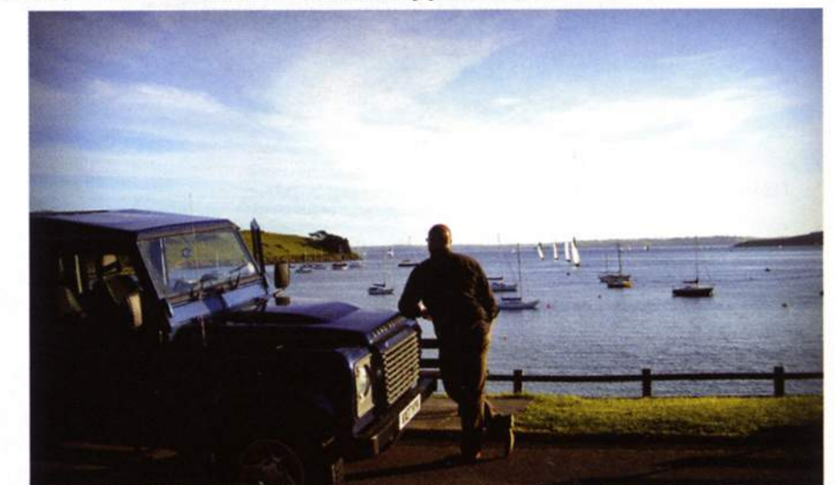
Deze Reportage kwam tot stand dankzij de steun van: Land Rover, Eurotunnel, Visit Britain