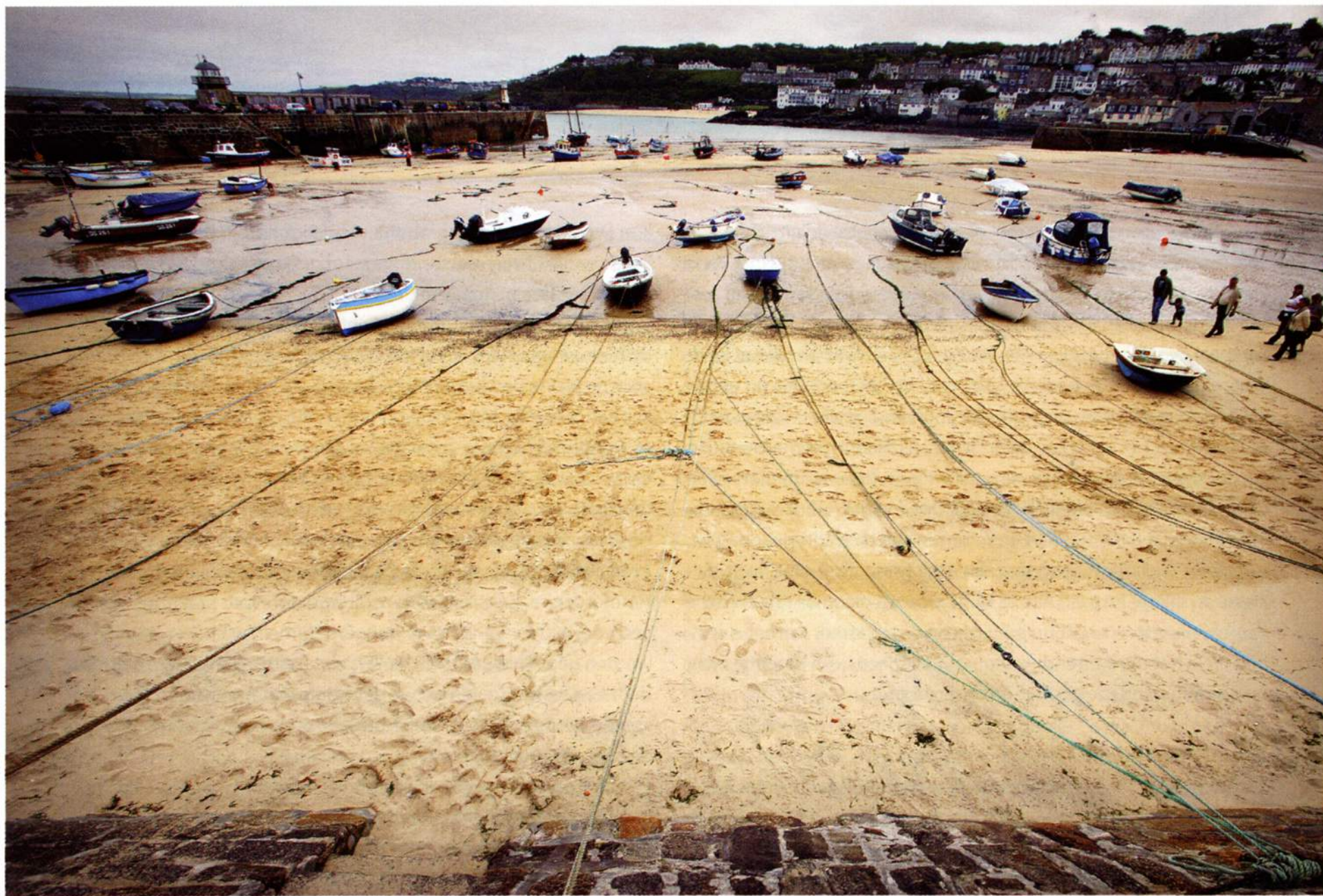
De westkust, dat zijn ook talloze havenstadjes (hier: St Ives) waar de pleziervaart in grote en kleine dimensies aanwezig is.