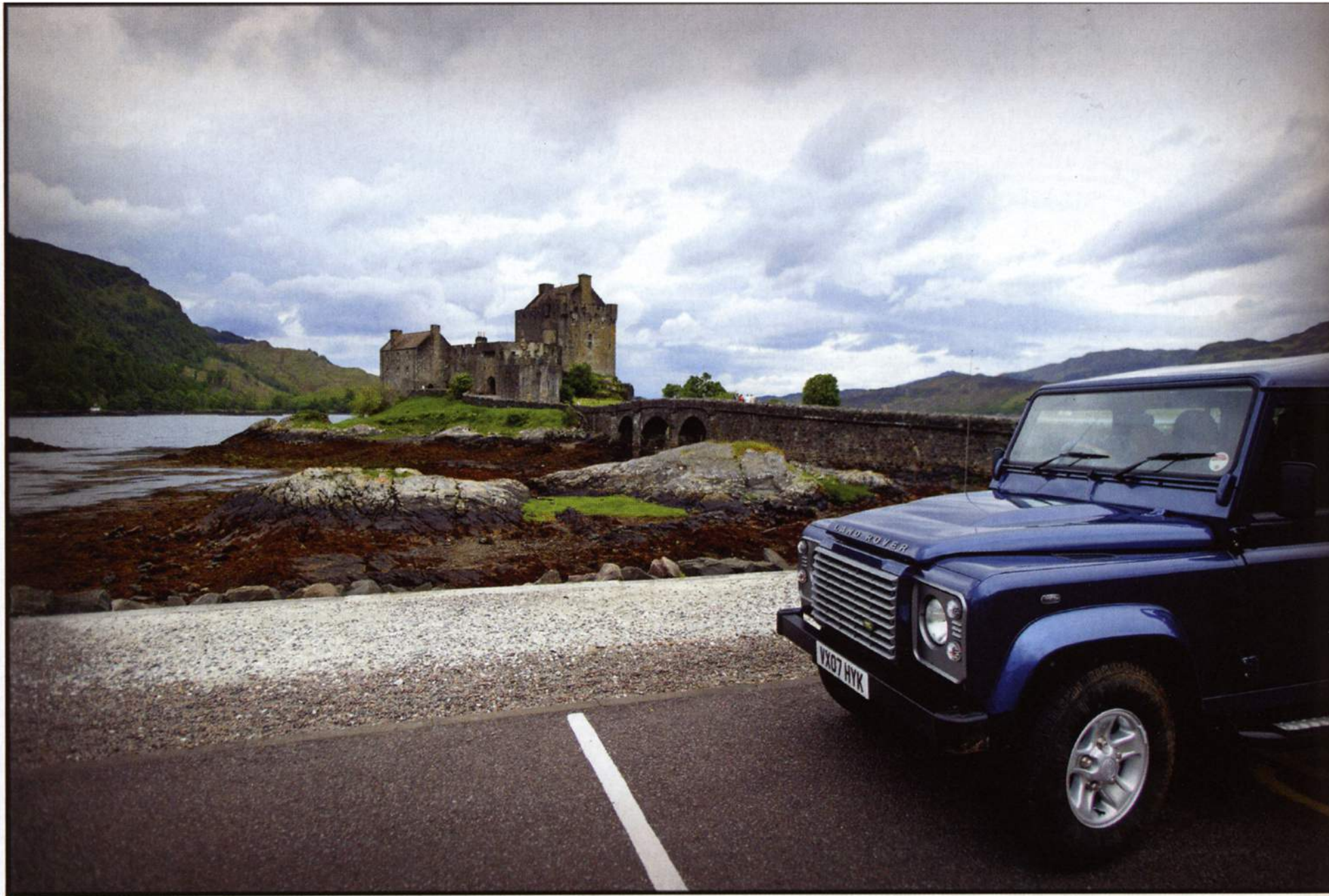
Onder: Torquay, het stadje waar het fictieve gammele hotel uit de tv-serie 'Fawlty Towers' stond, kreeg een verregaande opfrisbeurt.