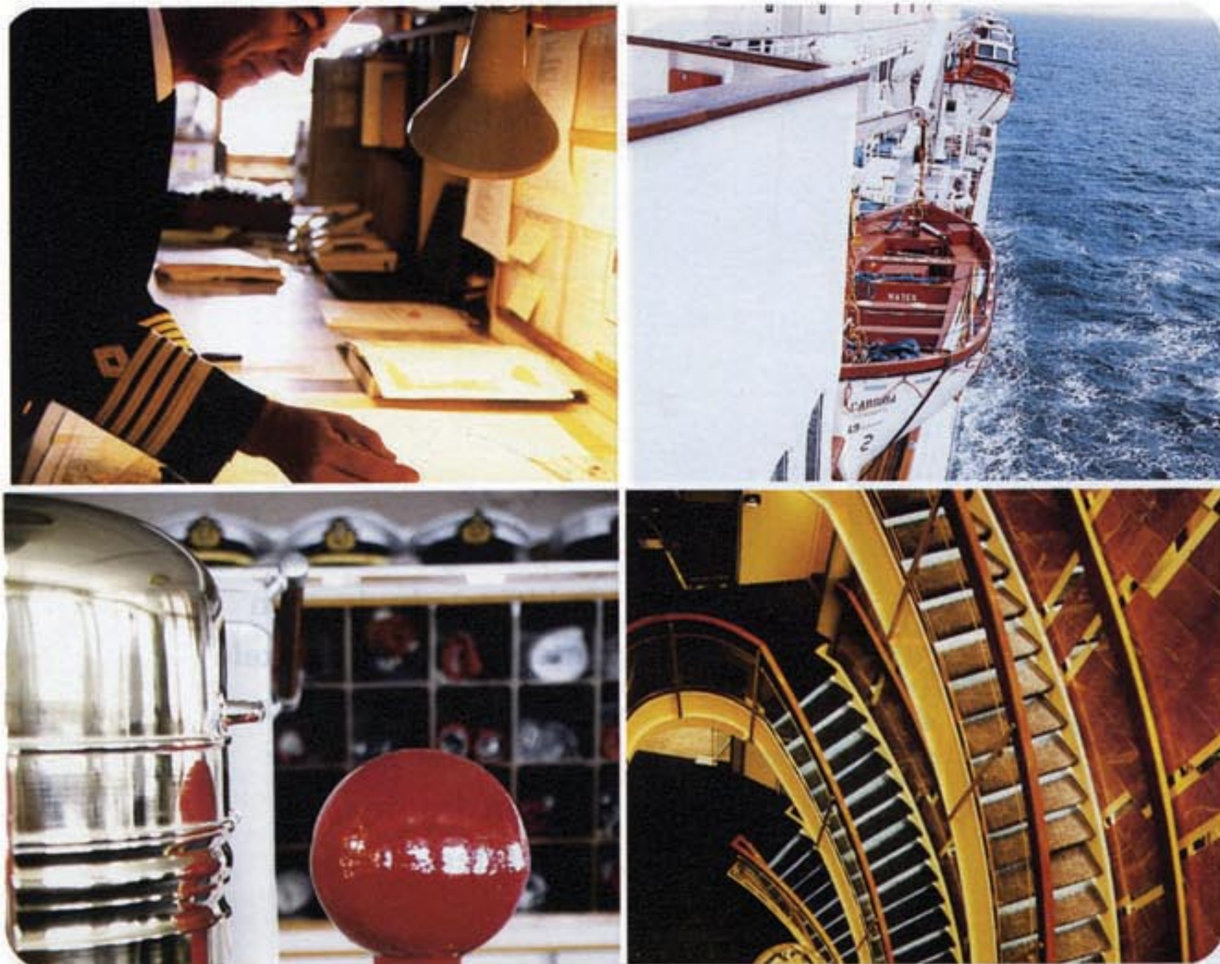
Alles op het schip moet er netjes uitzien, ook de plaatsen waar alleen de bemanning komt.

gen. Verspreid doorheen de dag staan allerlei sportactiviteiten gepland. Een golftraining, een tafeltenniswedstrijd, allerlei gym- en aerobicsoefeningen. Om de Britse traditie in ere te houden is er een bridge- en bingowedstrijd voorzien. De opbrengst gaat naar een goed doel. Een schoonheidssalon biedt massages en andere weldoende behandelingen, kinder- en jeugdanimatie bevrijden de ouders.