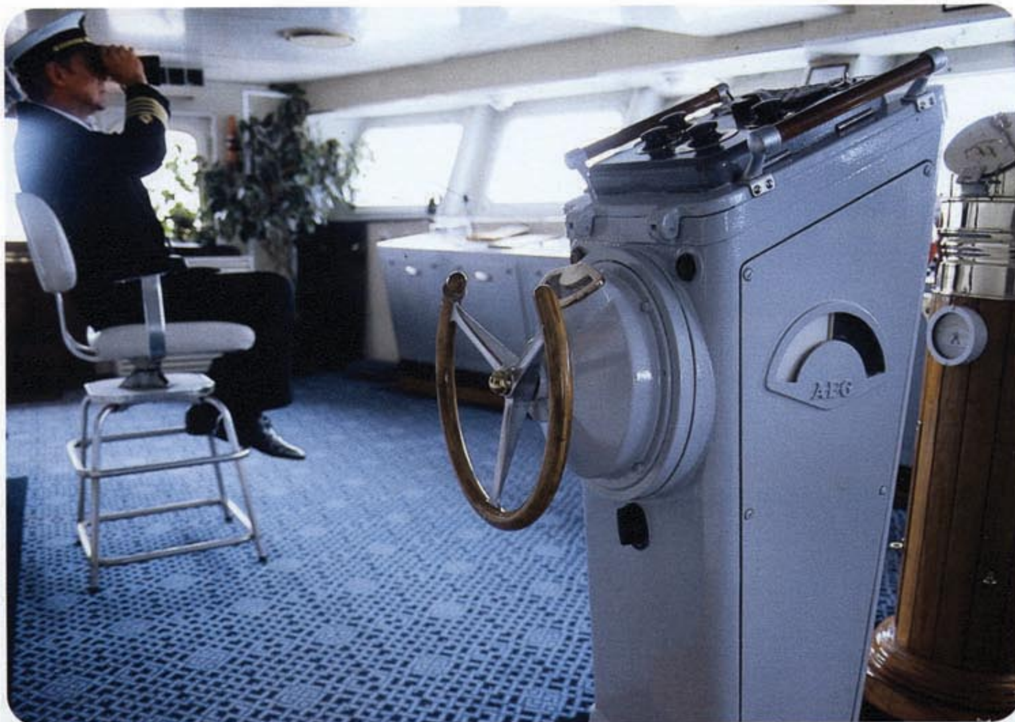
Op de brug is de concentratie van de zeelui haast voelbaar.

Een vriendelijke steward verwelkomt de passagiers. Hij wordt geflankeerd door een rij jongens en meisjes in keurig zwart-wit uniform. Sommigen zijn bijna even onwennig als de reizigers die aan boord komen, want het is hun eerste reis sinds lang. De Caronia is net uit het droogdok. Met zorg voor de traditie van de oude ocean liners is ze weer te water gelaten. Het oorspronkelijke interieur en de decoratie zijn zoveel mogelijk behouden. Het schip, net als grote zus de Queen Elizabeth II , behoort toe aan de Cunard -rederij. Die rederij is een van de oudste ter wereld en heeft in de voorbije 160 jaar een bepalende rol gespeeld in het passagierstransport. Ook in de scheepvaart in het algemeen schreef ze geschiedenis. Zo was Cunard de eerste om bak- en stuurboord door middel van de, nu overbekende, groene en rode signaallichten aan te duiden. Rond de eeuwwisseling nam de reder ene Guglielmo Marconi aan boord met zijn revolutionaire innovatie: de radiotelegrafie. Tussen 1840 en 1900 bracht Cunard zowat de helft van de ruim 18 miljoen emigranten naar Amerika.