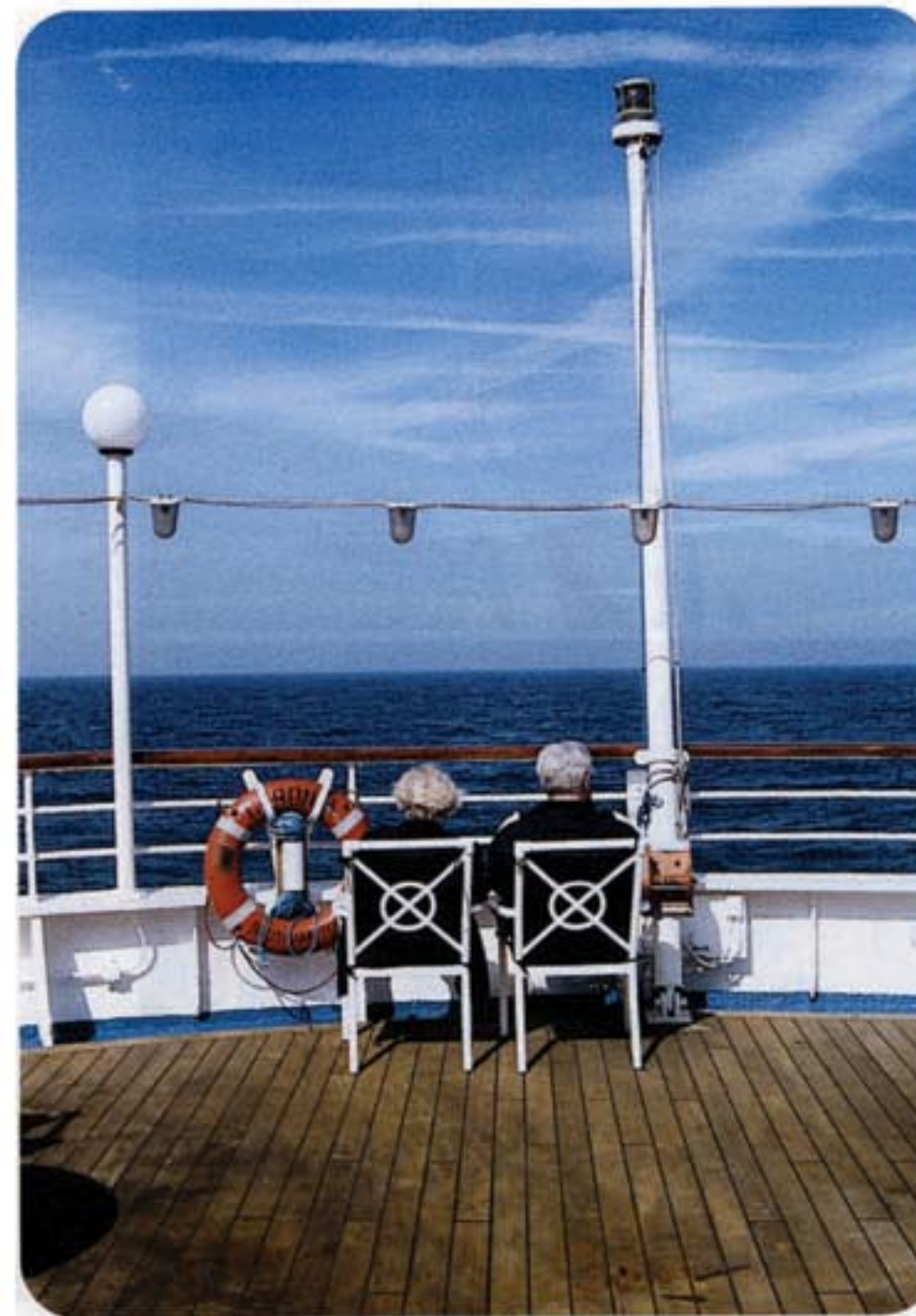
Zalig nietsdoen in stijl is wat de meeste passagiers op de Caronia zoeken.

Het kader van het avondmaal beantwoordt helemaal aan mijn verwachtingen. Het somptueuze decor geeft een gevoel van klassieke luxe. De heren zijn verzocht stads- of