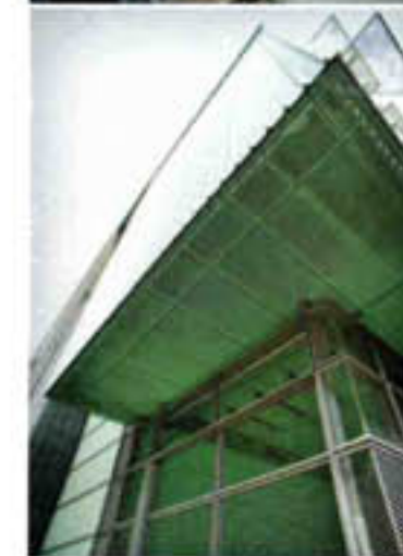
Luzern: Het KKL (linksboven) met zijn zwevende dak. De bar sluit aan bij de sobere design van het SAS-hotel (rechtsboven). Het terras tegenover The Hotel is een van de trefpunten voor de hippe vogels van Luzern.