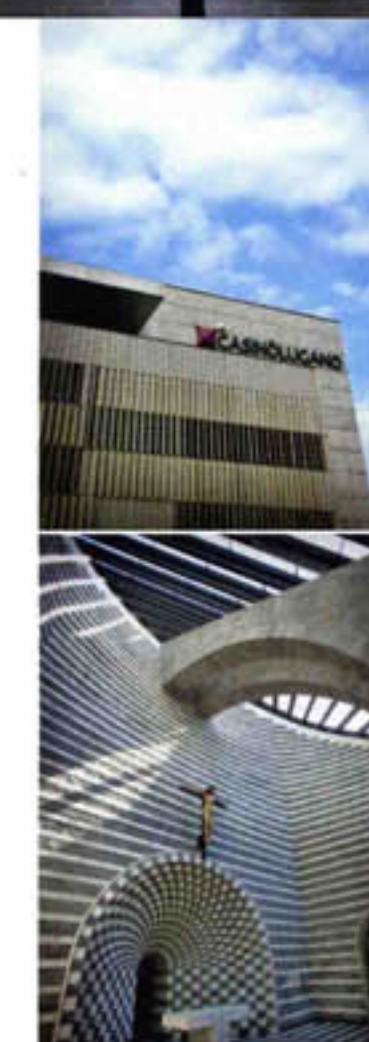
Linksboven: het busstation van Lugano, soberder dan het vroegere werk van Botta in zijn stad. Rechtsboven: de fragiele fresco's in de kerk van Monte Tamaro. Het gesloten lijnenspel van het casino van Lugano boven het lyrische motief van de kerk in Mogno.

De toeristen zijn weg, op één meisje na. Ze weet niet dat ik er ook nog ben. Geruisloos staat ze op en loopt aarzelend achterom het altaar. Dan, na enig twijfelen, legt ze in een traag gebaar haar hand op die van het fresco. Misschien is een gezonde dosis scepticisme voor het nieuwe een filter voor kwaliteit. Alleen de tijd zal het uitwijzen. En in het geval van Zwitserland, zal die tijd een mensenleven ver overtreffen. ¶