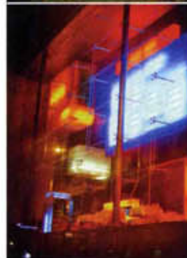
Restaurant Castel Grande in Bellinzona, bereikbaar via de 'baarmoeder' (midden). Rechts de eetzaal van hotel La Claustra , diep in de berg. De badkamer van La Claustra; laagjes berg, gestapeld tot monolithisch kuuroord in Vals; en het casino van Lugano.

meest op een venster lijkt in deze ruimte. Afgesloten van alle buitenelementen ontbreekt het bepaalde zintuigen aan prikkels. Lichaam en geest proberen het verlies te compenseren met fantasie en opnieuw word ik geconfronteerd met de afwezigheid van de vierde dimensie: tijd.