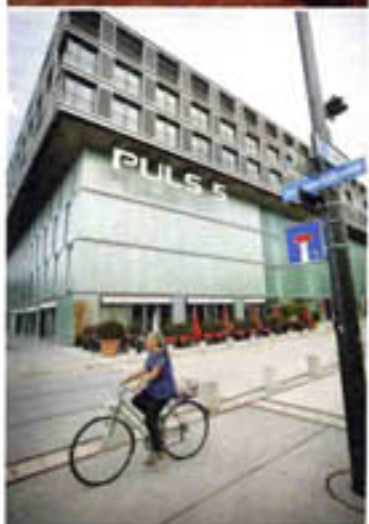
Zürich: champagnebar Al Leone (linksboven) en de laatste constructie van Le Corbusier (rechts). De Freitag-toren als containerbaken en de vele geherwaardeerde industriepanden rond het Technopark vormen het hart van het trendy Zürich West.

Of ik naar Zwitserland wil om er de hipfactor fotografisch op te meten. Nu had ik enkele jaren geleden aan de hand van een architectuurexperte mooie beelden en herinneringen overgehouden aan de hedendaagse bouwwerken die er toen uit de grond rezen. Een land met de meest hippe vlag in haar grafische eenvoud, rijk en met stijlvolle Italianen, ingenieuze Duitsers en creatieve Fransen als burens moet een smeltkroes van kwalitatieve trendyness zijn.